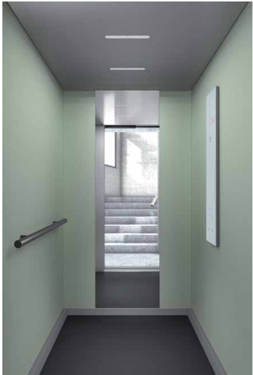
Schindler 3300 - Cabina verde Tahiti.

Esta herramienta ha ampliado sus prestaciones e incluye un nuevo módulo de diseño de interiores de cabina y rellanos, dotado de la última tecnología en visualización de alta definición. Las ventajas que ofrece este módulo de diseño Schindler Digital Plan parten de que el nivel de interacción entre el producto y el usuario se hace más factible gracias a la interfaz visual e intuitiva de la que dispone. Asimismo, la visualización en tiempo real y en alta definición de todas las configuraciones estándar es otro de los adelantos que ponemos a disposición de los arqui-