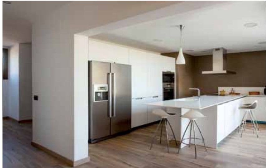
Interior de la vivienda: Salón, escaleras y cocina.