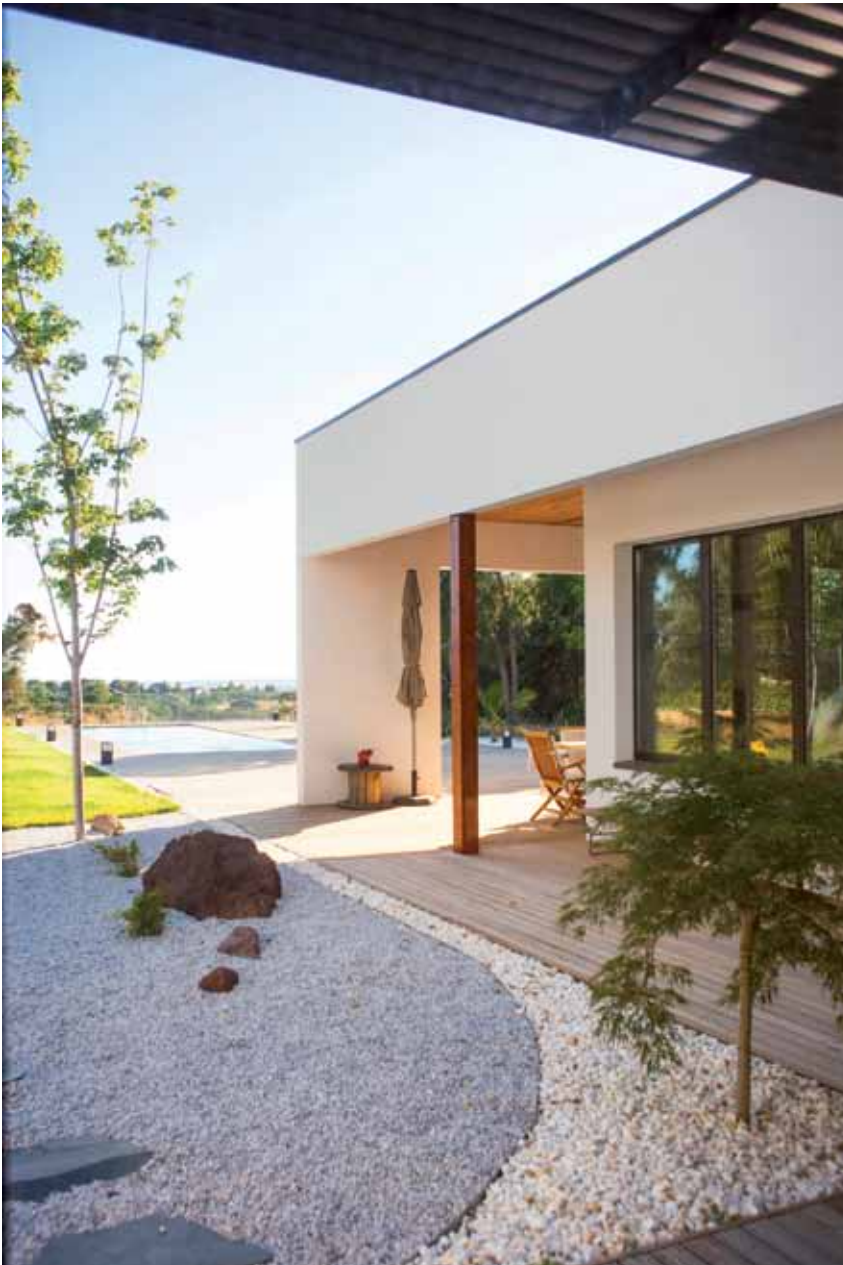
Exterior de la vivienda (esta página y las anteriores).

bado en revoco de cal y mortero al silicato, tablero OSB3 de 15mm, entramado de madera de 198mm con aislamiento de fibra de madera en su núcleo, barrera de vapor, cámara de 48-73 mm aislada para paso de instalaciones y yeso laminado o friso de madera como acabado interior.